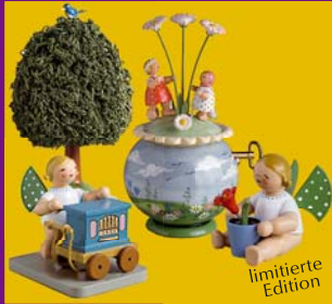
Wendt & Kühn